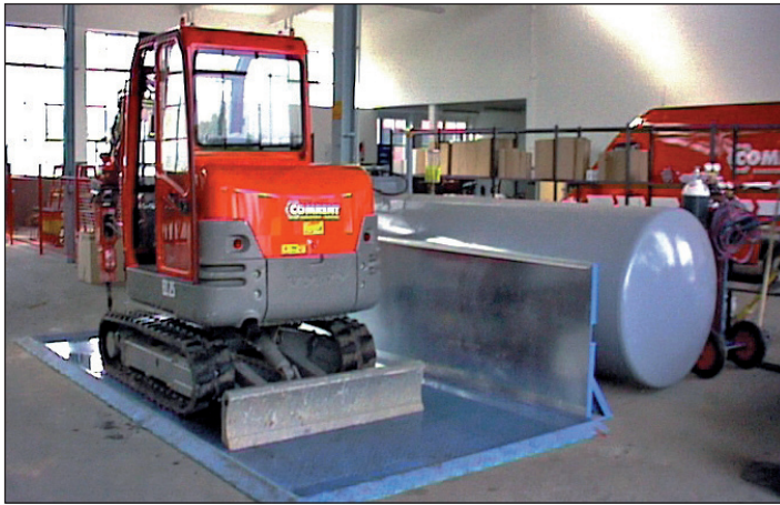
Typ TAW mit Anfahrtschutz (Zubehör)