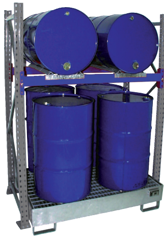
Grundregal Typ 3008