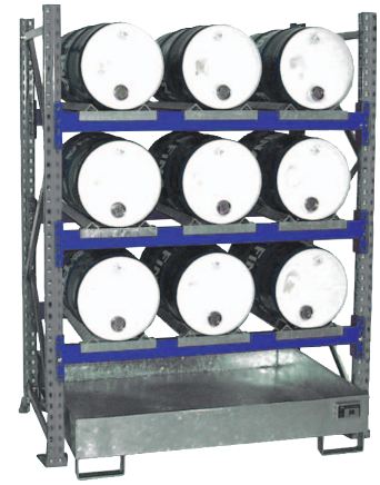
Grundregal Typ 3004