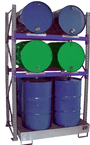
Grundregal Typ 3010