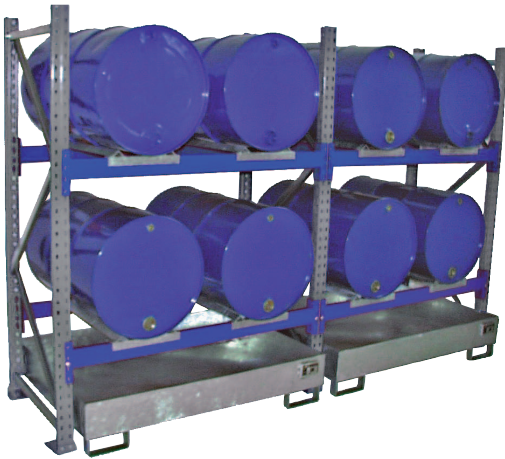
Grundregal Typ 3000 + Anbauregal Typ 3001