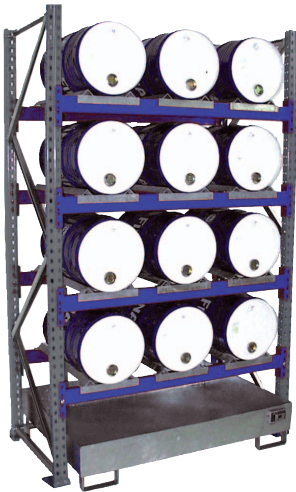
Grundregal Typ 3006