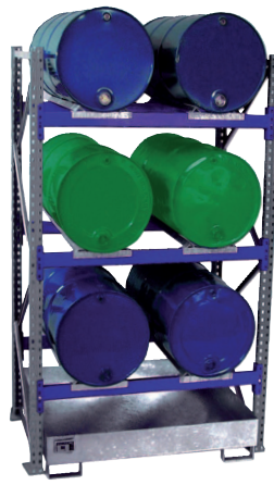
Grundregal Typ 3002