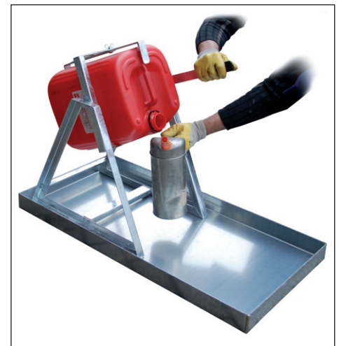
Typ KGW 2 mit Kanister-Abfüllhilfe Typ KAH-25 siehe Seite 83