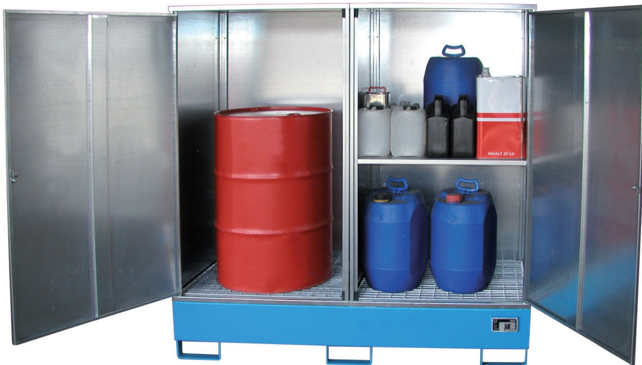
Typ GS-2 mit Zwischenboden (Zubehör)