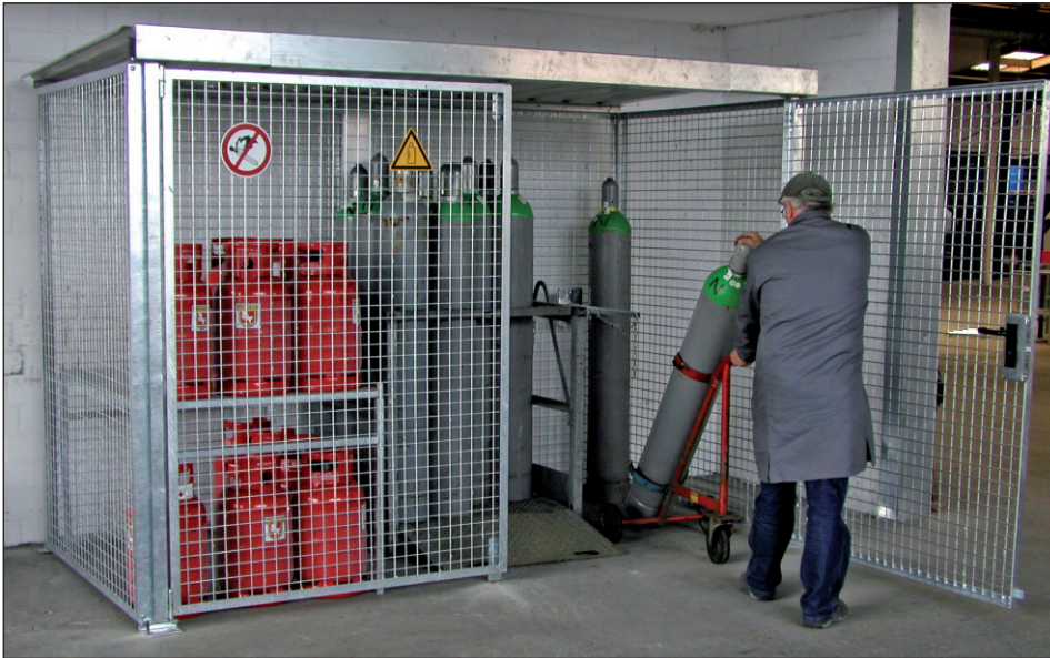
Typ GFC-M/D mit Doppelflügeltor und Gasflaschenwagen (Zubehör)