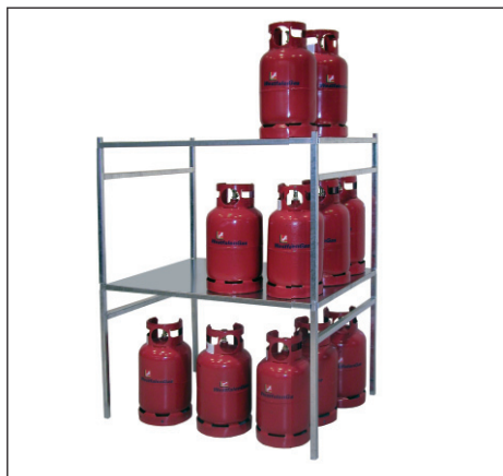
Gasflaschengestell Typ GFG, gestapelt (Zubehör)