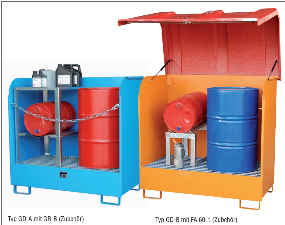
Typ GD-A mit GR-B (Zubehör)