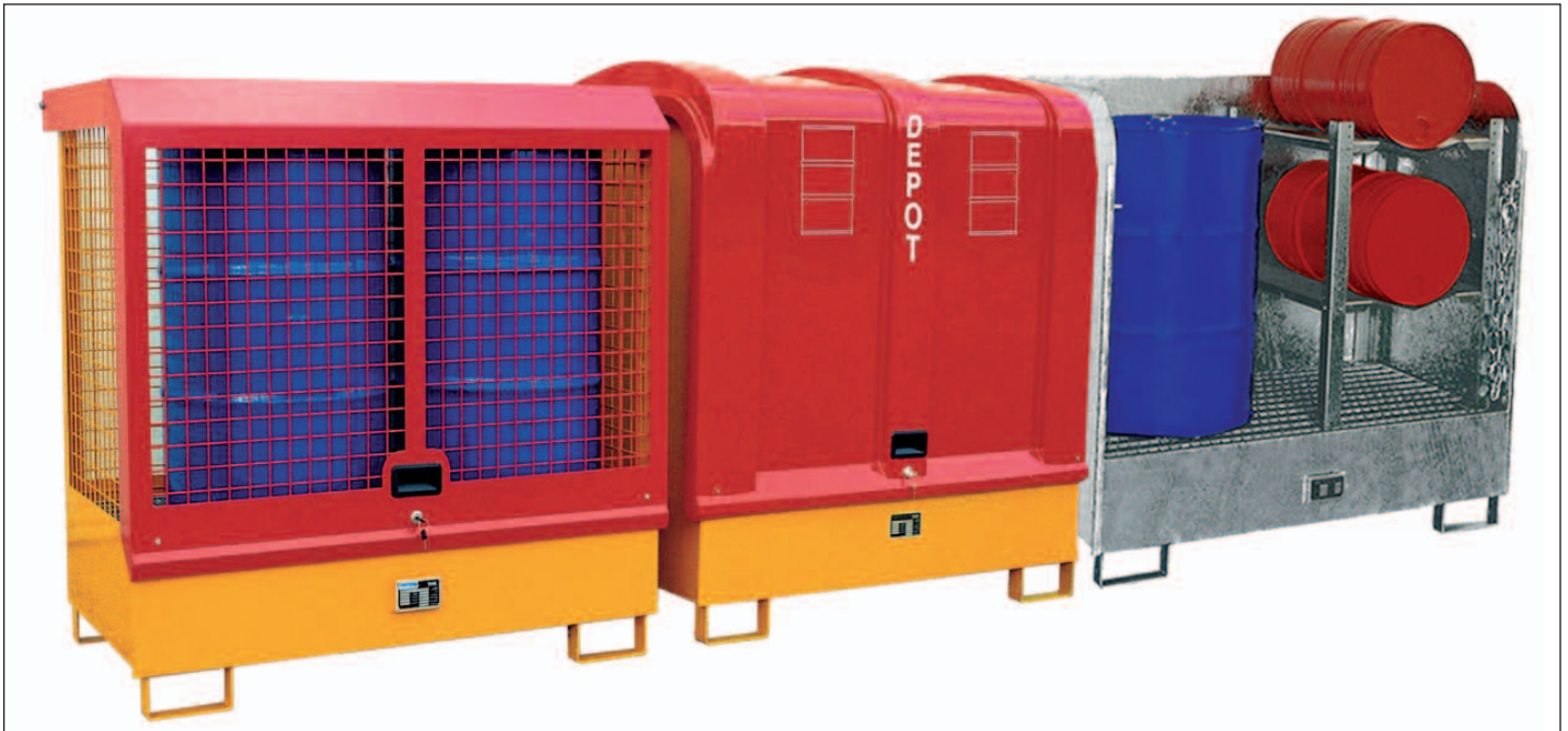
Typ GD-C, GD-B und GD-A mit GR-C (Zubehör)