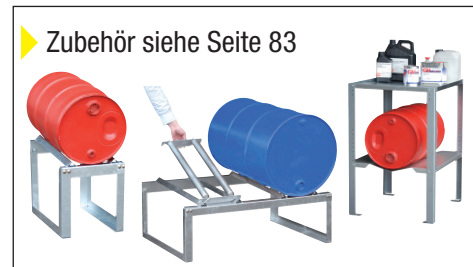
► Zubehör siehe Seite 83