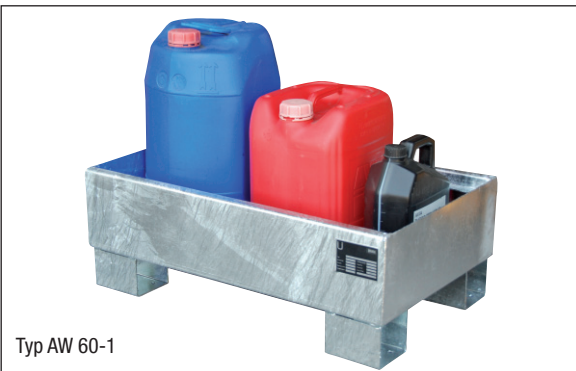
Typ AW 60-1