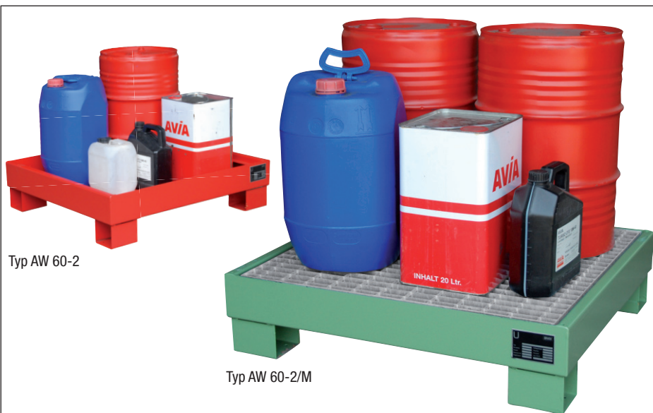
Typ AW 60-2