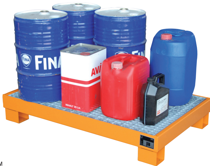
Typ AW 60-3/M

Lagern und Abfüllen von 60-l-Fässern und Kleingebinden