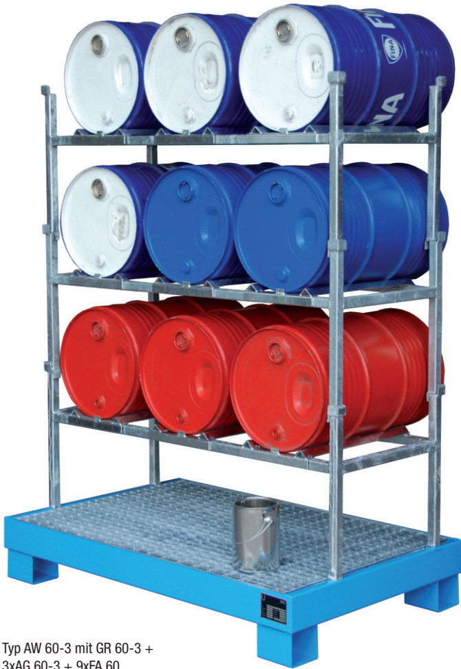
Typ AW 60-3 mit GR 60-3 + 3xAG 60-3 + 9xFA 60