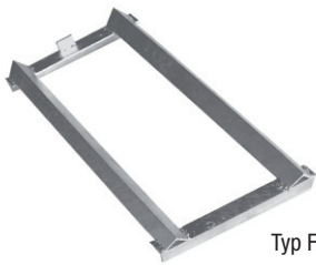
Typ FA 60