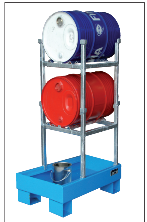
Typ AW 60-1 + 2xAG 60-1+ 2xFA 60