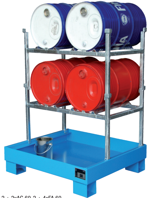
Typ AW 60-2 + 2xAG 60-2 + 4xFA 60